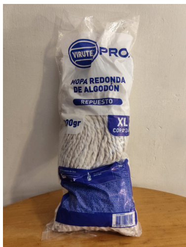
Mopa Virutex Pro XL 300gr $4.730 IVA Incluido