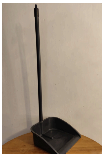
Pala $1.150 IVA Incluido