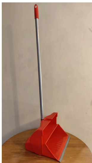
Pala Plástica con Goma $ 9.550 IVA Incluido