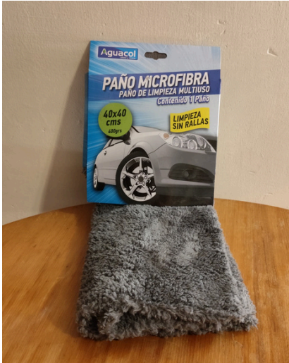
Paño Microfibra Aguacol 40cm x 40cm $2.050 IVA incluido