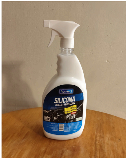
Silicona Brillo y Protección Aguacol 1Lt $4.600 IVA incluido